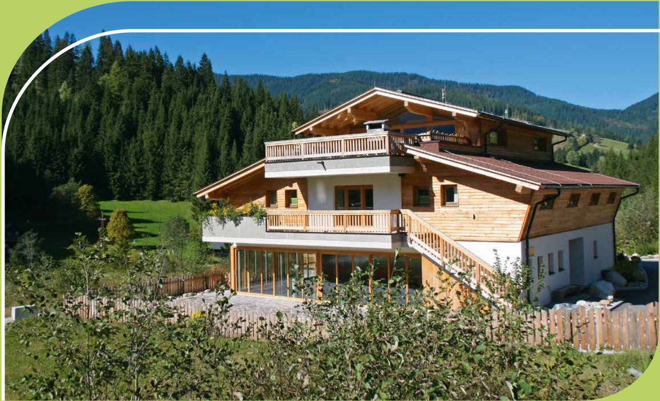
ALPIN CHALET LARGE IN FILZMOOS