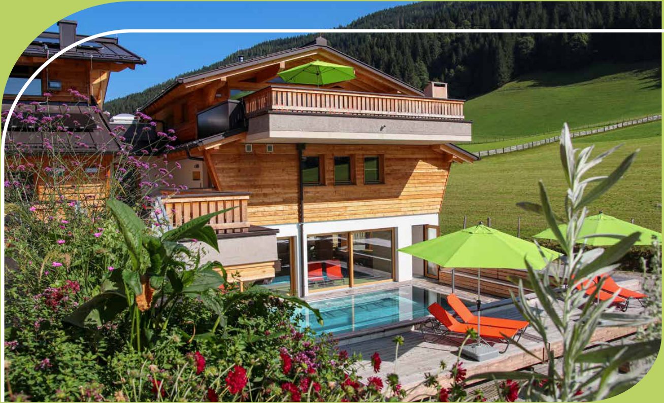
ALPIN CHALET LARGE IN KLEINARL