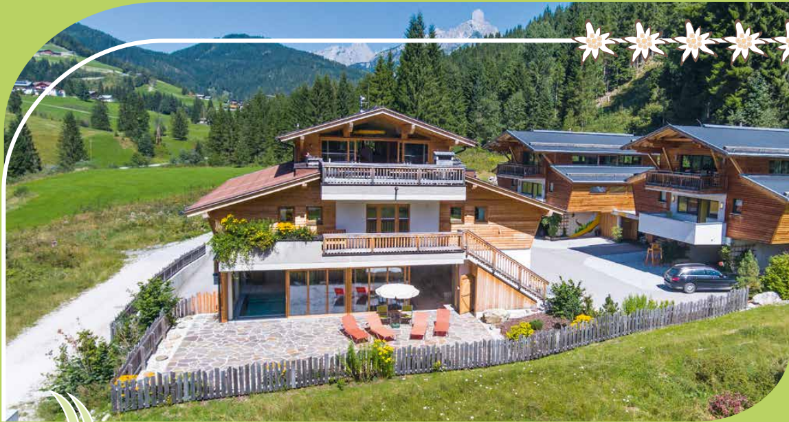
ALPIN CHALET LARGE IN FILZMOOS & KLEINARL