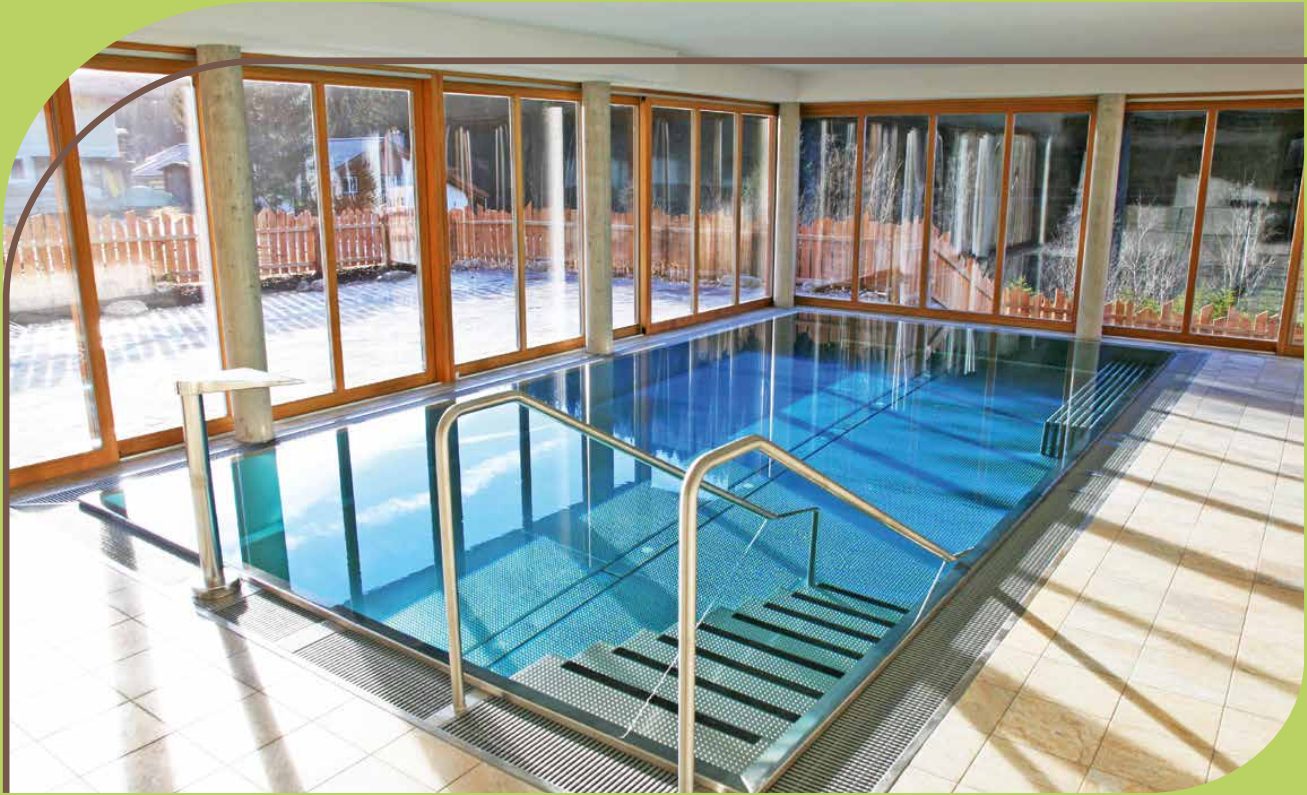
ALPIN CHALET LARGE IN FILZMOOS